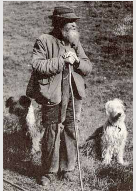
Les conditions de vie et de travail des bergers comme de leur chiens devaient être bien rudes!